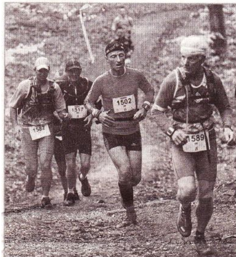
Equipés de leur lampe frontale, les coureurs du 36 km étaient parés pour la tombée de la nuit.