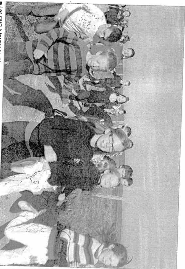
■ Les CM2 à toutes foulées sur les chemins de la campagne de Saulnot.

Sur un effectif de 27 élèves, 18 sont volontaires avec l'assentiment des parents pour participer à la course de 1 km en cœur de ville. « Ils ont bien saisi l'enjeu collectif, et l'esprit d'entraide pour décrocher le 1er prix de la plus grande participation. Le sport n'est pas antinomique à l'apprentissage du savoir, bien au contraire quand on est bien dans son corps on est bien dans sa tête», explique-t-elle. Chaque jeudi depuis 1 mois, toute la classe s'entraîne sur la distance en pleine nature sur un